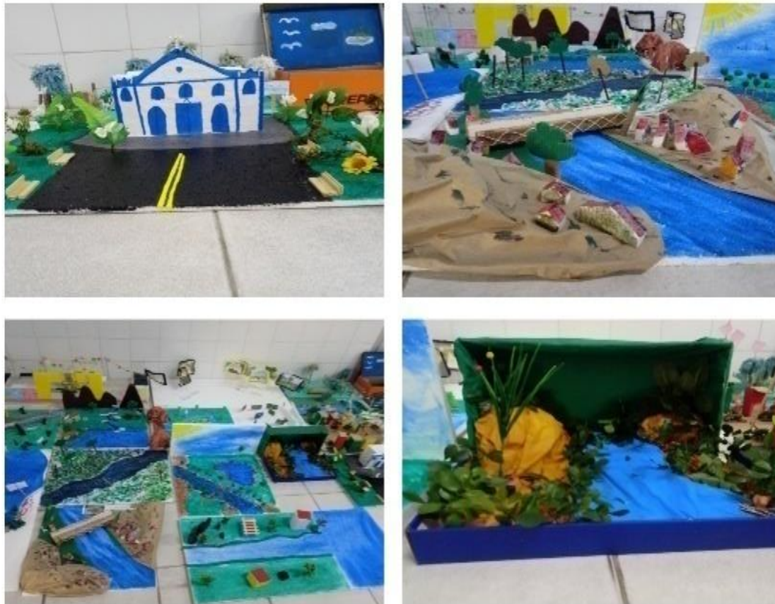
Figura 1 – Exposição de maquetes

Na figura 1, é notável a exposição das maquetes elaboradas pelos alunos durante as atividades requeridas no Estágio Supervisionado.