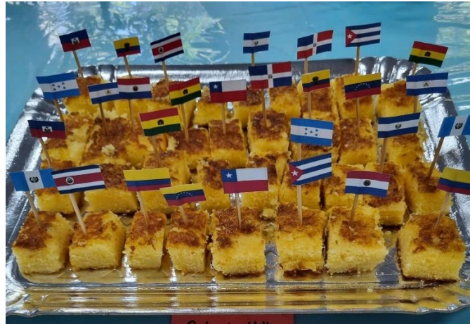
Figura 1 - Café de recepção da Feira Latina