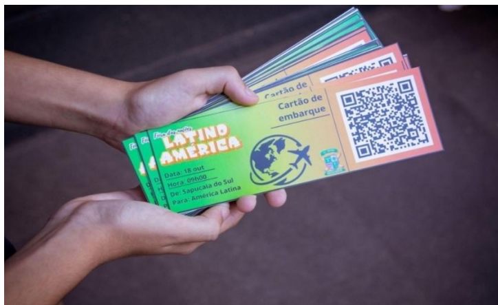
Figura 4 - Cartão de embarque para a Feira Latina

espanhol e, na sequência, já nas barracas, as turmas apresentaram suas pesquisas e ofereceram pratos típicos à comunidade escolar. Todo o evento foi organizado pela Comissão de professoras e pela Comissão de alunos/as, que organizou a disposição das barracas, auxiliou na decoração, na recepção, na apresentação artística, entre outros.