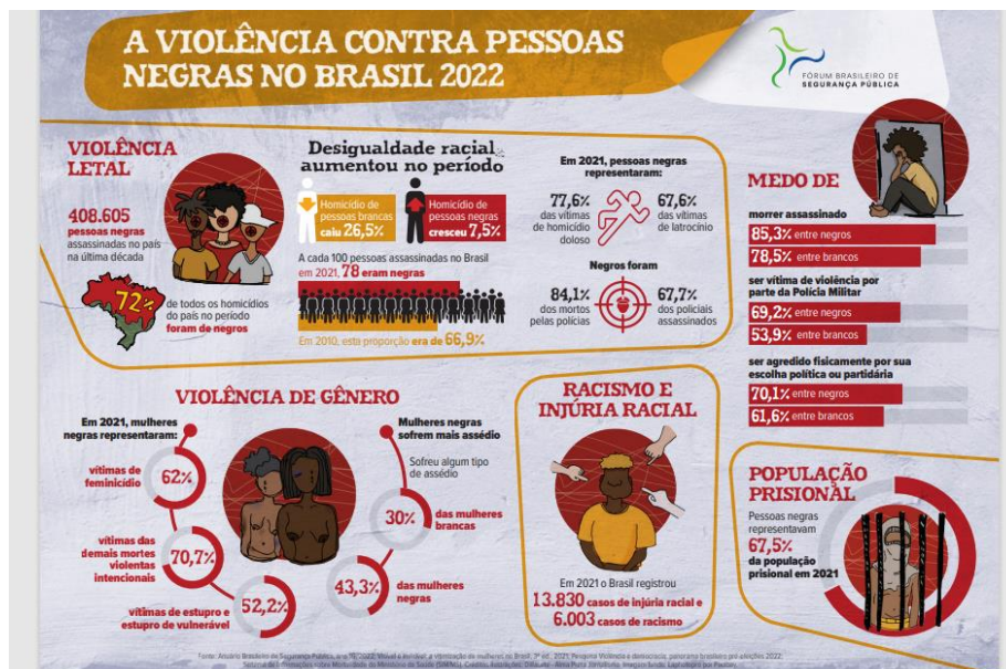
Figura 1 – A violência contra pessoas negras no Brasil 2022

Fonte: Fórum Brasileiro de Segurança Pública, (2022).