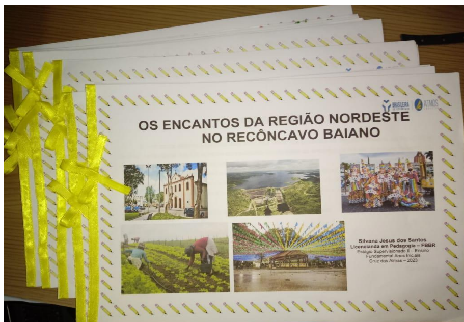
Figura 2 – Produto Final do Estágio Supervisionado