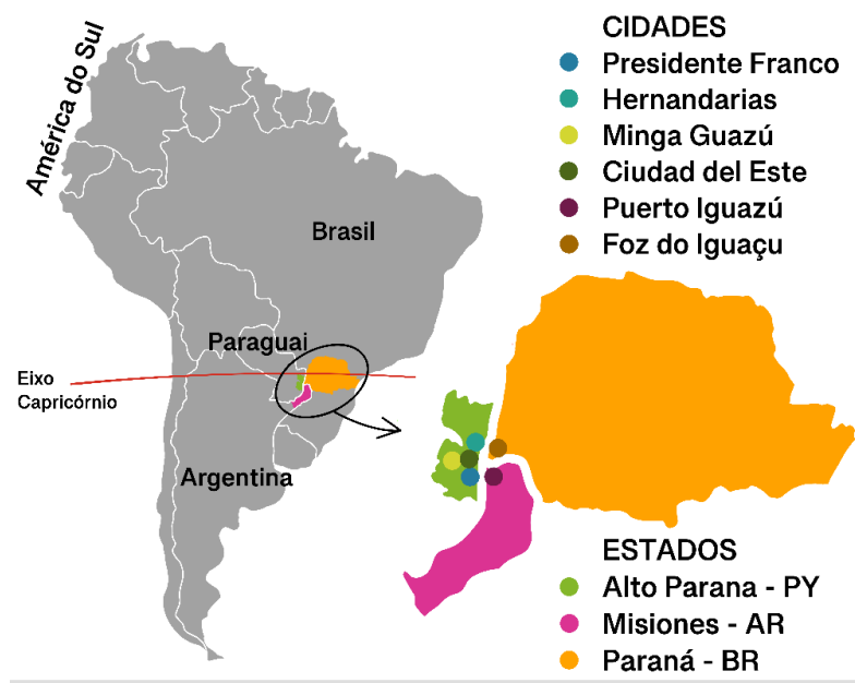
Figura 3 – Mapa da Região Trinacional do Iguazu na América do Sul