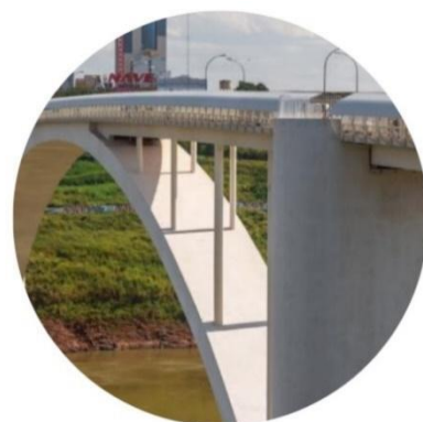
Figura 2 - Puente de la Amistad

El territorio de Iguazú se ubica en el corazón de las aguas que forman la cuenca del Río de la Plata, entre los ríos Paraná e Iguazú, uniendo Brasil y Argentina por medio del Puente Internacional de la Fraternidad (1985) y Brasil a Paraguay por medio del Puente Internacional de la Amistad (1965); y, en breve, el Puente de la Integración.