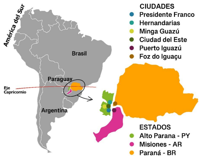
Figura 3 – Mapa de la Región Trinacional del Iguazú en América del Sur